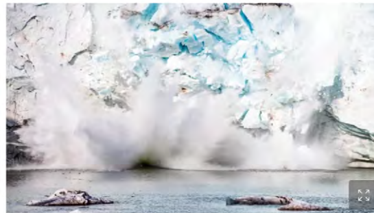
Photo prise en août 2019 du glacier Apusijajik, près de Kulusuk, au Groenland.

Par Anne-Laure Frémont et AFP agence Publié le 25/08/2020 à 14:43, mis à jour le 25/08/2020 à 15:00